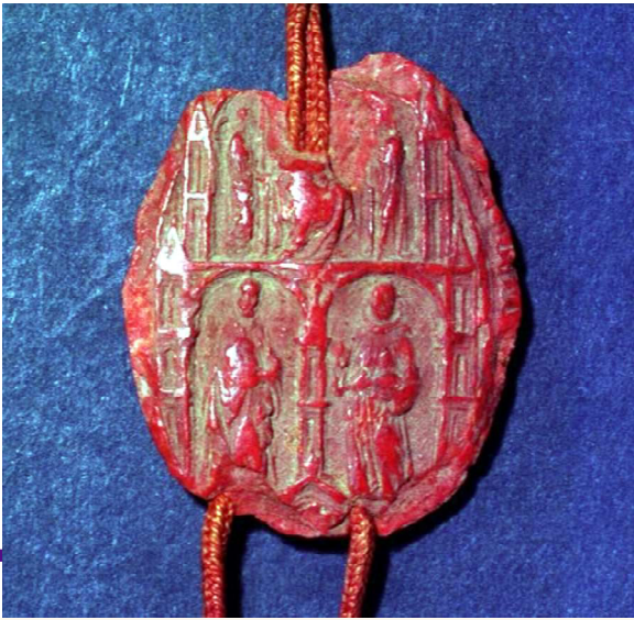
Il sigillo del cardinal Gentile da Montefiore, da una pergamena del 1302.

magistri Petri vicarii et (***) procuratorum cleri florentini ad contribuendum cum eis in procurationibus nostris, quas sibi imponendis duximus, vos per nostras certi tenoris litteras dedimus ad nitores. Cum itaque sicut nuper nobis exponere curavistis, super contributione huiusmodi cum eis minime impedenda inter vos ex una parte et dictum clerum ex altera in romana curia questio ventiletur. Nos nolentes ut per contributionem ipsam (***) vestro in hac parte preiudicium aliquod generetur vos et monasterium vestrum quantum ad nos spectat ab impositione facta vel facienda vobis per vicarium ante dictum prefata nostra concessione per dictas litteras ei facta non obstante tenore presentium reddimus absolutos. In cuius rei testimonium presentes vobis litteras fieri fecimus et nostri sigilli appensione muniri. Datum Luce VII id. iunii pont. domini Clementis pp. quinti anno septimo”.