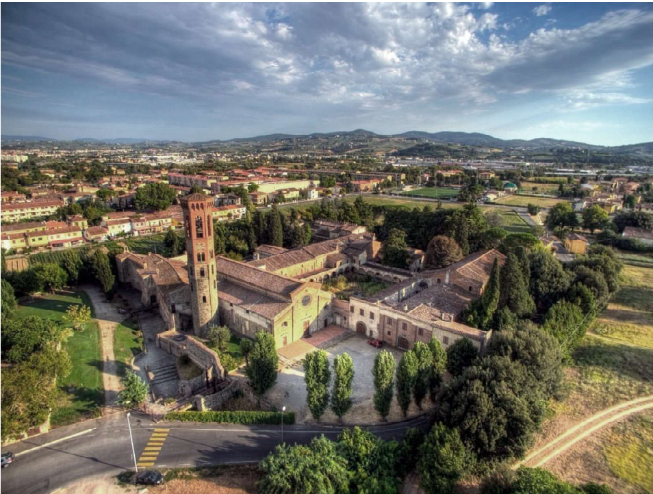
La Badia di Settimo vista dall'alto.

L'antica abbazia di San Salvatore a Settimo sorge a Scandicci poco distante dalla riva sinistra dell'Arno ed è ben visibile con il suo originale campanile anche a chi percorre in treno il tratto da Signa a Firenze.