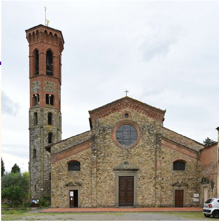
La Badia di Settimo oggi.

faziosissima politica del tempo. Altri documenti danno ulteriori precisazioni.