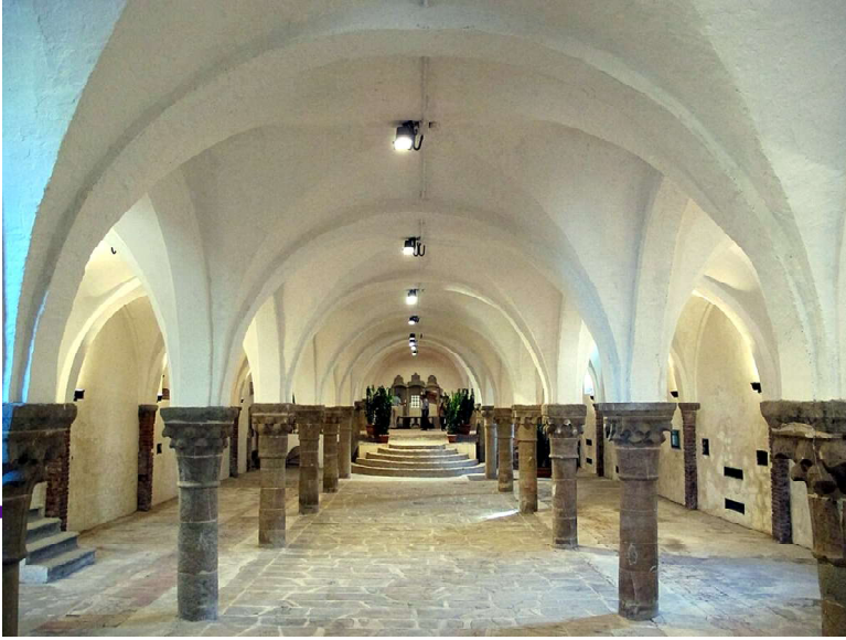
L'antico granaio di San Salvatore a Settimo, da Wikimedia Commons.

et magna ipsius sancte religionis honestate conspicuos in se habet dinoscitur specialem devotionem habentes vobis universis et singulis sub nostre indignationis et qualibus alia pena quam vobis vellemus infligere districte precipiendo, mandamus quatenus cum nos dictum ordinem cum membris locis personis et bonis suis sub nostra protectione suscepimus, ipsumque benevolentie nostre favoribus prosequamus monasterium sancti Salvatoris de Septimo dicti ordinibus florentine diocesis quod sub dicta nostra protectione consistit et consistere volumus, non presumatis in personis vel bonis suis quibuscumque quomodolibet molestare. Datum in castris ante Florentiam VI kal. novembris regni nostro anno quarto imperii nostro primo” (cfr. F. Bonaini, Acta Henrici VII ... ).